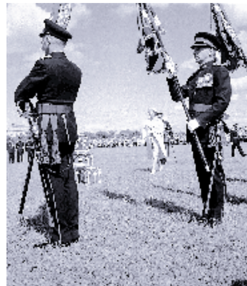
LA REINE ÉLIZABETH II À QUÉBEC, 1959.