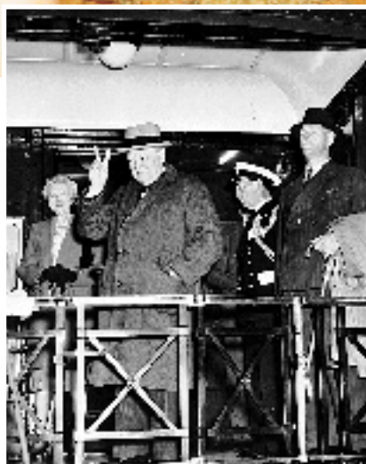
WINSTON CHURCHILL LORS DE LA PREMIÈRE CONFÉRENCE DE QUÉBEC, 1943.

Archives nationales du Québec, Neuville Bazin, E6, S7, P2721-59-H.