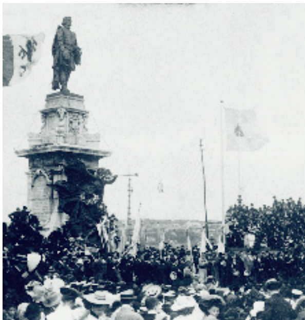
LES FÊTES DU TRICENTENAIRE DE QUÉBEC AU PIED DU MONUMENT CHAMPLAIN, 1908.

Voici un extrait de la lettre de Pie XI au cardinal Villeneuve, archevêque de Québec, le constituant son légat au Congrès eucharistique national de Québec.