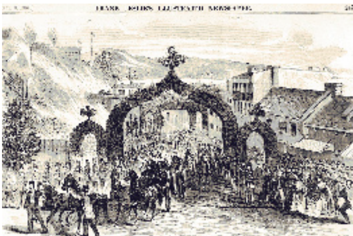
VISITE DU PRINCE DE GALLES À QUÉBEC EN 1860.

Québec est le seul port de mer et la seule ville de commerce du Canada; c'est d'ici que tous les produits du pays sont exportés. [...] Les vaisseaux peuvent y mouiller à l'aise et en sûreté dans vingt-cinq brasses d'eau et sur un fond excellent pour l'ancrage. [...] Les marchands s'habillent fort élégamment et poussent la somptuosité dans les repas jusqu'à la folie. Les femmes sont tous les jours en grande toilette et parées autant que pour une réception à la cour (Voyage de Kalm en Amérique, 1880).