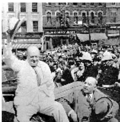
WINSTON CHURCHILL LORS DE LA SECONDE CONFÉRENCE DE QUÉBEC, 1944.

Archives nationales du Québec, Roger Bédard, P600, S6, P431 (1943)-4.