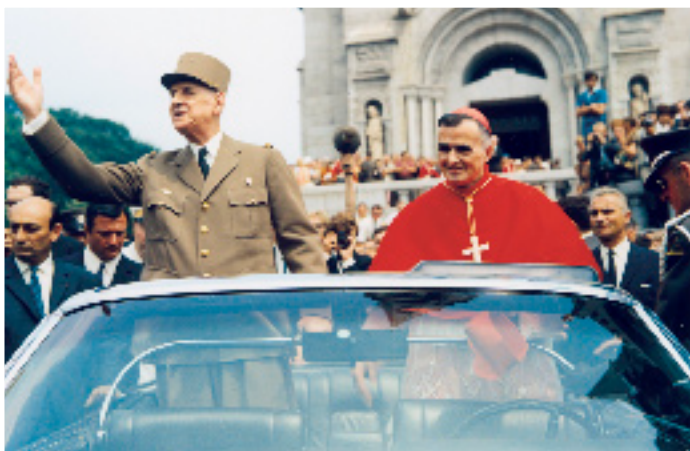
CHARLES DE GAULES À LA BASILIQUE DE SAINTE-ANNE DE BEAUPRÉ, 1967. Archives nationales du Québec, Magella Chouinard, E6, S7, P6711190.