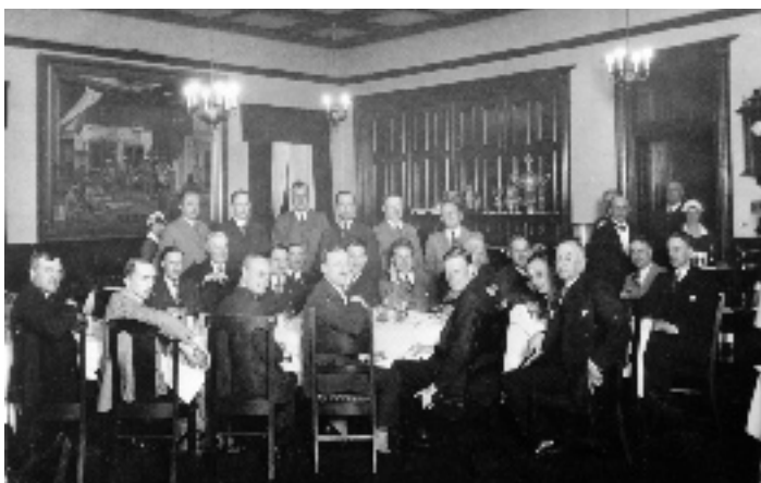
CHARLES LINDBERG AU CERCLE DE LA GARNISON, 1928.

Les chanteurs sont aussi fort nombreux à s'être produits sur les scènes artistiques de Québec, notamment celles du Palais Montcalm et de « Chez Gérard » : Édith Piaf (mai 1955), Jacques Brel (novembre 1965), Léo Ferré (février 1970), Nana Mouskouri (janvier 1967 et novembre 1970) et Georges Moustaki (janvier 1971).