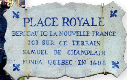
© Samantha Rompillon / CIEQ, 2003, Q03-91

▲ La seconde habitation est complétée en 1628 selon des plans dessinés par Champlain. Vétuste, elle est démolie en 1688 pour faire place à l'église Notre-Dame-des-Victoires. Six campagnes de fouilles, réalisées entre 1975 et 1988, ont permis d'en révéler les secrets et d'enrichir la collection archéologique de référence de Place-Royale, classée depuis 1999. Quant à l'habitation, les vestiges sont toujours enfouis : seule un marquage au sol en révèle la présence.