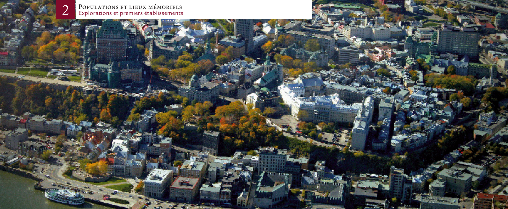
▲ Le Vieux-Québec, aujourd'hui. Sur les hauteurs, le Château Frontenac et le Séminaire dominent la basse ville. Au pied du Château, Place-Royale, où tout a commencé.

© Éliane Galarneau et Marc St-Hilaire, 2007