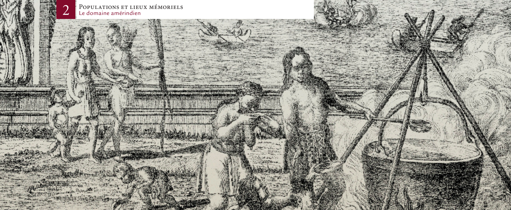
▲ Jean-Baptiste Franquelin, «Vue de Québec», 1699 [détail]