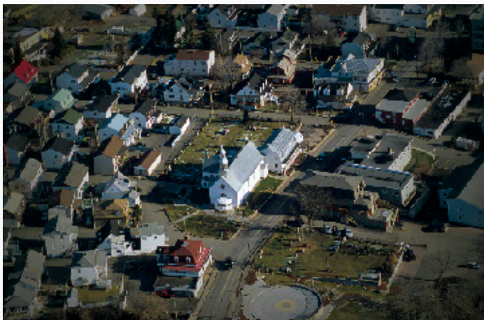
◀ Établis dans la région de Québec à partir de 1650, les Hurons-Wendats s'installent finalement à Wendake en 1697. L'église de la mission Notre-Dame-de-Lorette est construite en 1730 sur le modèle de celle de Santa Casa de Lorette en Italie. Incendiée en 1862, elle est reconstruite en 1865-1866 sur les murs de l'ancienne chapelle. Superbement décorée et dotée d'une riche collection d'objets liturgiques, l'église a été classée monument historique en 1957 et lieu historique national en 1981. Le site comprend également le cimetière et un calvaire.

Dans la plupart des cas, ces groupes fréquentant davantage le bord de mer étaient en contact avec d'autres vivant eux surtout à l'intérieur des terres. Pour ces derniers, la chasse, la pêche et la trappe assuraient la subsistance. Comme pour les peuples du littoral, des campements témoignent d'une