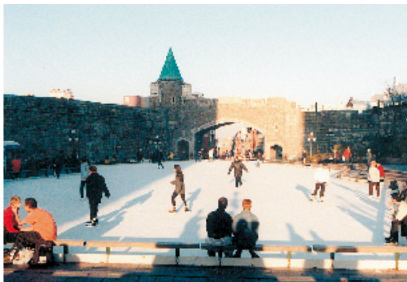
PATIN À LA PLACE D'YOUVILLE, 1999.

Reprenant l'idée des Médiévales qui n'eurent pas de suite, les Fêtes de la Nouvelle-France proposent, depuis 1997, de replonger dans une autre époque, celle des débuts de la colonie. À cette occasion, la place Royale, la place de Paris, le parc Montmorency, le parc de la Cetièrre, la batterie Royale, le parc de l'UNESCO, le parc Félix-Leclerc et un grand nombre de rues du Vieux-Québec deviennent le théâtre de scènes de ménages, de messes à l'ancienne, de la tenue d'un marché public, de ripailles, d'un bal populaire, etc. D'autre part, les participants peuvent découvrir la vie à l'époque de la seigneurie, en apprendre plus sur leur généalogie, les Amérindiens et les coureurs des bois. À mi-chemin entre le mythe et l'histoire, les Fêtes de la Nouvelle-France reviennent tous les étés et entrent peu à peu dans les traditions festives de la ville.