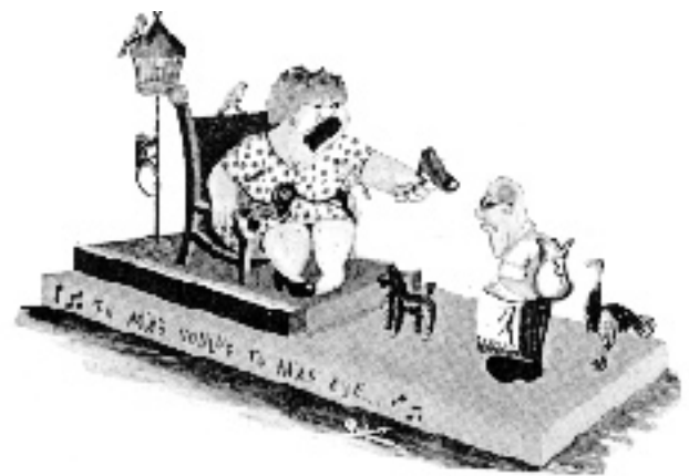
CHAR ALLÉGORIQUE ILLUSTRÉ DANS LE PROGRAMME SOUVENIR OFFICIEL DU CARNAVAL, 1966.

Quelques événements à ne pas manquer : Le Carnaval d'hiver de Québec, en février ; Le Festival international d'été de Québec, en juillet ; Les Fêtes de la Nouvelle-France, en août ; L'événement pyrotechnique des Grands Feux Loto Québec, aux chutes Montmorency, dernière semaine du mois de juillet et deux premières du mois d'août.