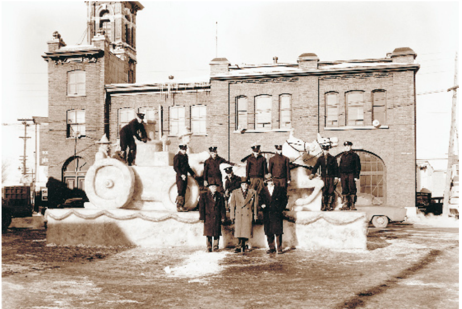
MONUMENT DE GLACE D'UN ATTELAGE DE POMPIERS EN FACE DU POSTE À FEU, 1955.