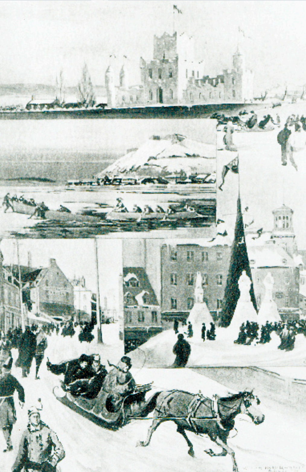
DIVERSES VUES DU CARNAVAL D'HIVER : PALAIS DE GLACE, MONUMENTS, COURSE DE CANOTS, 1894.

The costumes were most gorgeous. Lord and Lady Aberdeen were only there as spectators, the Governor General wearing black creamer's coat and mink cap, and lady Aberdeen a snowshoer's long blanket coat. (A short account of Ye Quebec Winter Carnival Holden in 1894, G.M. Fairchild. J. R. Printed by Frank Carrel. 1894.)