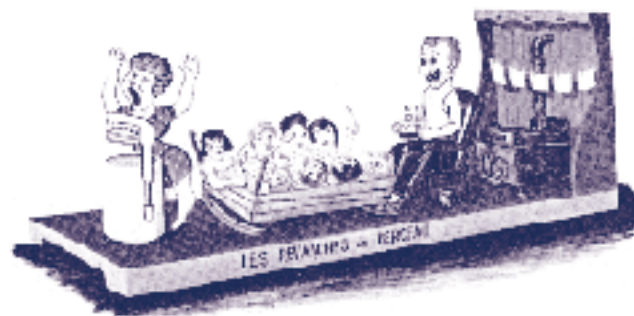
CHAR ALLÉGORIQUE ILLUSTRÉ DANS LE PROGRAMME SOUVENIR OFFICIEL DU CARNAVAL, 1966.

négatif n° 09001.