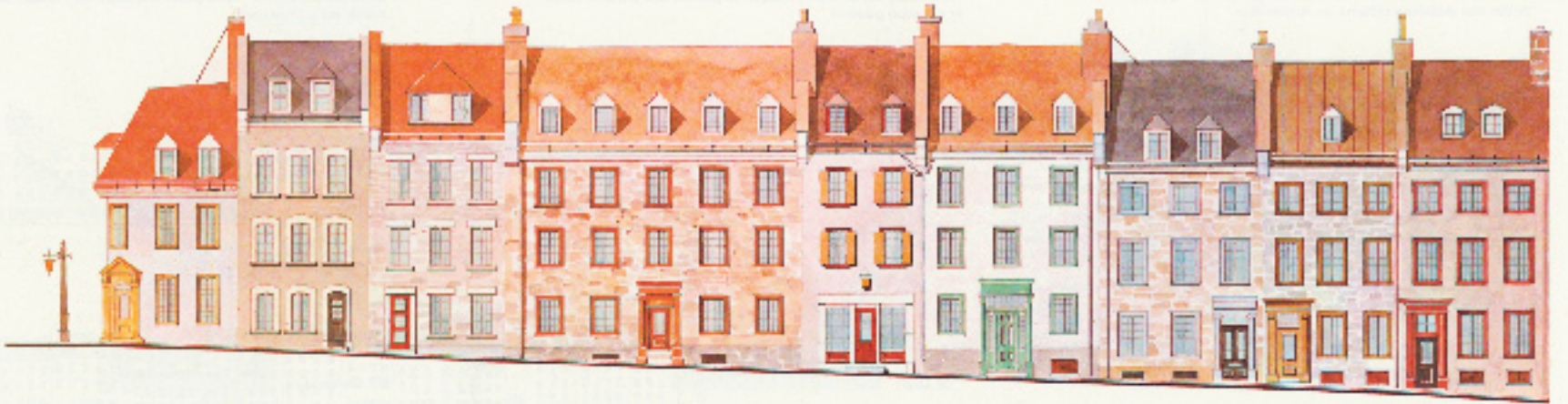
Reconstitution des bâtiments sur St Ursula, côté nord.

phique, archéologique et touristique qui continue encore aujourd'hui à rendre au Vieux-Québec sa physionomie française. En 1960, beaucoup de bâtiments de la partie basse du Vieux-Québec avait subi des détériorations et certains étaient abandonnés. La circulation y était bruyante et souvent paralysée, et le stationnement constituait un véritable défi. Confrontés à des perspectives d'avenir difficiles, la ville, le gouvernement provincial et nombre d'hommes d'affaires lancèrent un appel pour redonner vie à l'image de marque du Vieux-Québec et tirer profit de son originalité. L'étude qui en résulta, intitulée Concept général de réaménagement du Vieux-Québec , fut réalisée en 1970. Dans ce rapport, d'autres plans de restauration et de protection, comme ceux de La Nouvelle-Orléans (Louisiane), San Juan (Porto-Rico) et Saint-Nazaire (France) servirent de modèles à la mise au point d'un plan global détaillé de restauration du Vieux-Québec. Le rapport préconisait un investissement initial de 27 millions$. Cela permettait de commencer le travail de destruction des entrepôts, des hôtels et des appartements vétustes, afin de créer les aires de stationnement nécessaires et d'apporter un commencement de solution aux épineux problèmes de circulation, en détournant une partie du trafic de la basse-ville grâce à un réseau d'autoroutes, comme l'autoroute Dufferin-Montmorency et l'autoroute de la Capitale, mises en service dans les années 1970 et au début des années 1980.