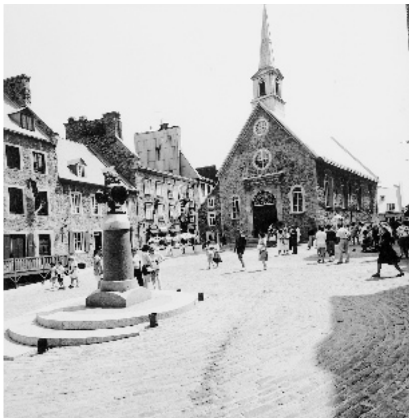
LA PLACE ROYALE ET NOTRE-DAME-DES-VICTOIRES EN 1989, VINGT ANS APRÈS LES DÉBUTS DE LA RÉNOVATION INTENSIVE DU QUARTIER.

Archives de la Ville de Québec, Communications, négatif n° 29632.