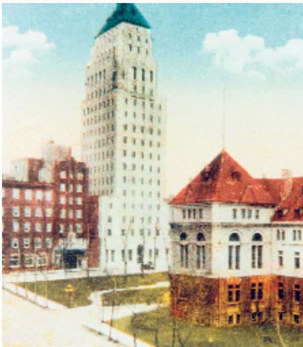
LE PREMIER GRATTE-CIEL DE QUÉBEC : LE BÂTIMENT PRICE EN VOIE D'ACHÈVEMENT, VERS 1930.

Dans la première moitié du XX e siècle, la rapide croissance industrielle et démographique, conjuguée à l'apparition de l'automobile, obligèrent Québec à transformer les murs qui l'enfermaient et les rues étroites et tortueuses de ses plus anciens quartiers. Pour s'adapter à ces changements, de nombreux immeubles et vieilles maisons furent détruits, des rues élargies, et de larges avenues furent percées dans les années 1920 et 1930 — souvent sans plan global d'urbanisme ou de préservation du patrimoine. Ce ne fut pas seulement l'introduction de nouveaux matériaux, de l'acier, du béton et du goudron; ce fut aussi une mutation architecturale profonde: le caractère très « Ancien Monde » des bâtiments, des rues et des résidences de Québec était menacé par cette modernisation et cette « américanisation » de sa physionomie.