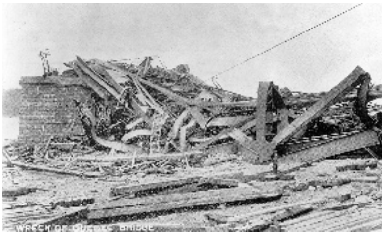
LES RUINES DU PONT DE QUÉBEC APRÈS SON EFFONDREMENT EN 1907. Archives de la Ville de Québec, négatif n° 10248.