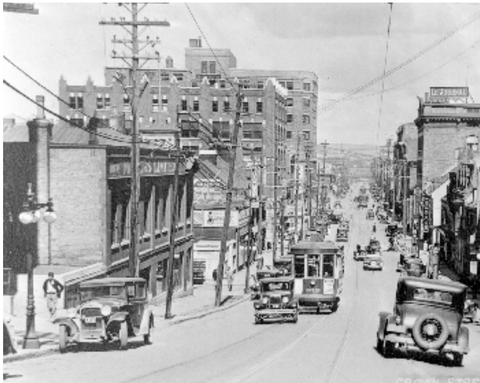
RUE DE LA COURONNE, 1925.

La modernisation massive de Québec durant les trois premières décennies du XX e siècle troubla certains habitants de la ville et en scandalisa plus encore. En novembre 1928, un éditorial paru dans Le Soleil commentait: « Il faut en finir une fois pour toutes avec le gâchis de la construction dans lequel chacun fait à sa tête et parvient à bafouer le bon sens et le bon goût en faisant jouer des influences. Trop d'entrepreneurs ont fait fi jusqu'à date de la solidarité et de l'esprit de civisme pour aller au gré de leurs seuls petits intérêts. Il est temps qu'une autorité quelconque intervienne et sauve de la disgrâce la plus belle partie de la vieille capitale. » En réponse à une forte pression de l'opinion publique, en 1928, le gouvernement provincial et la ville de Québec établirent une Commission d'urbanisme et de conservation pour diriger la croissance de Québec, tout en sauvegardant l'âme de la cité.