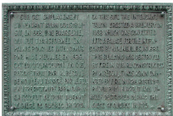
◀ Les fonctions du site sont connues et commémorées depuis longtemps : cette plaque a probablement été apposée lors du tricentenaire de Québec en 1908. Le texte laisse cependant entendre que la construction du second palais (1713) s'est effectuée exactement au même endroit que le premier. Les fouilles montrent qu'il est situé légèrement plus au nord.

La première série de campagnes de fouilles a été centrée sur l'ancien palais transformé en magasins du roi et dont les vestiges ont été mis au jour sous les premières occupations du début du Régime anglais, elles-mêmes sous les restes d'une importante brasserie, la brasserie Boswell, construite en 1852 et qui occupa les lieux jusqu'en 1968. De l'ancien palais intégrant la brasserie de l'intendant Talon, première occupation du site, les archéologues ont mis au jour les anciennes fondations, assez bien conservées pour